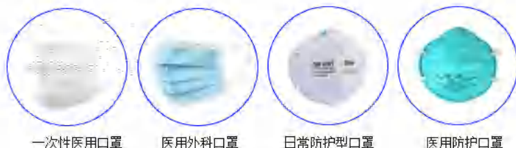
图 1 常见的口罩类型

根据适用范围的不同，纳入标准范围且可用于新型冠状病毒预防的口罩主要包括一次性使用医用口罩（YY/T0969-2013）、医用外科口罩（YY 0469-2011）、日常防护型口罩（GB/T 32610-2016）和医用防护口罩（GB 19083-2010）（图 1）。