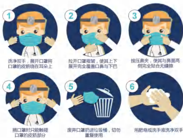
图 3 口罩正确佩戴方法图示