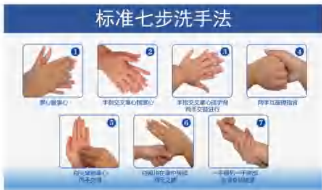
图4 标准“七步洗手法”

正确洗手的方法，先是干净的自来水彻底润湿双手，然后关闭水龙头并使用清洁剂进行清洗，再按标准“七步洗手法”搓洗双手（见图4），之后在干净的自来水下彻底冲洗双手。最后用干净的毛巾擦干双手、用烘干机或自然风干。