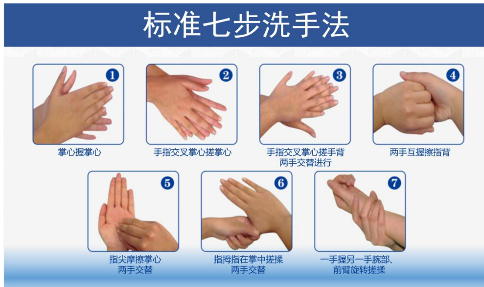
图 4 标准“七步洗手法”