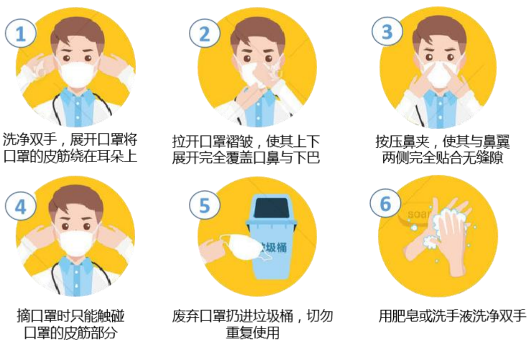
图 3 口罩正确佩戴方法图示