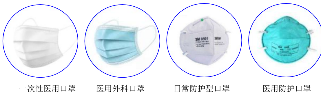
图 1 常见的口罩类型

根据适用范围的不同，纳入标准范围且可用于新型冠状病毒预防的口罩主要包括一次性使用医用口罩（YY/T0969 - 2013）、医用外科口罩（YY 0469 -2011）、日常防护型口罩（GB/T 32610 - 2016）和医用防护口罩（GB 19083 -2010）（图 1）。