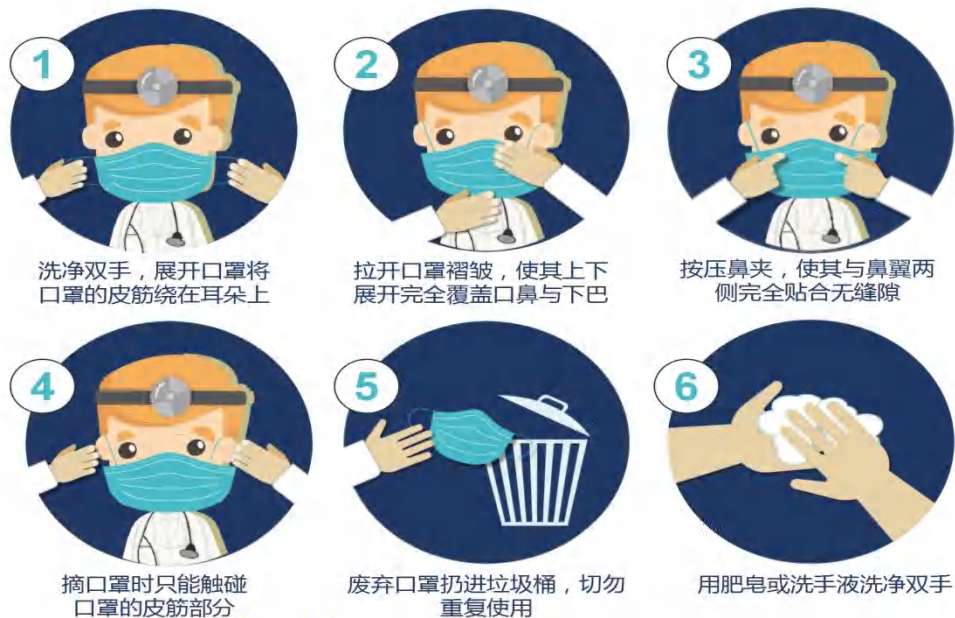
图3 口罩正确佩戴方法图示